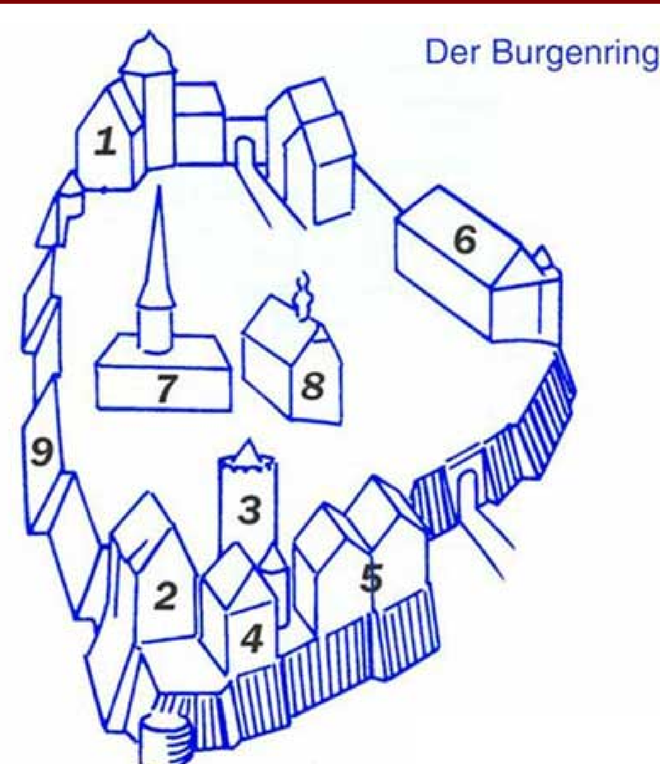
Stadt Schlitz (Hrsg.) - Burgenstadt Schlitz - Historischer Stadtrungang | Schlitz 1997.