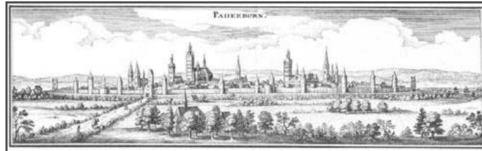
Matthaeus Merian der Ältere - Kupferstich zur Topographia Germaniae 17.Jhdt. | 1647.

Informationen für Besucher | Bilder | Grundriss | Historie | Literatur | Links