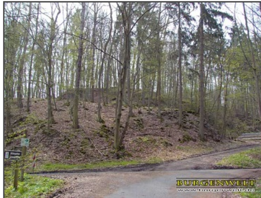
Topographia Hassiae, Matthäus Merian 1655

Informationen für Besucher | Bilder | Grundriss | Historie | Literatur | Links