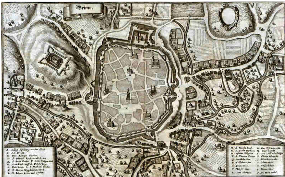
Quelle: Merian, Matthäus - Topographia Bohemiae, Moraviae Et Silesiae | Frankfurt am Main, 1650 (durch Autor leicht aktualisiert)