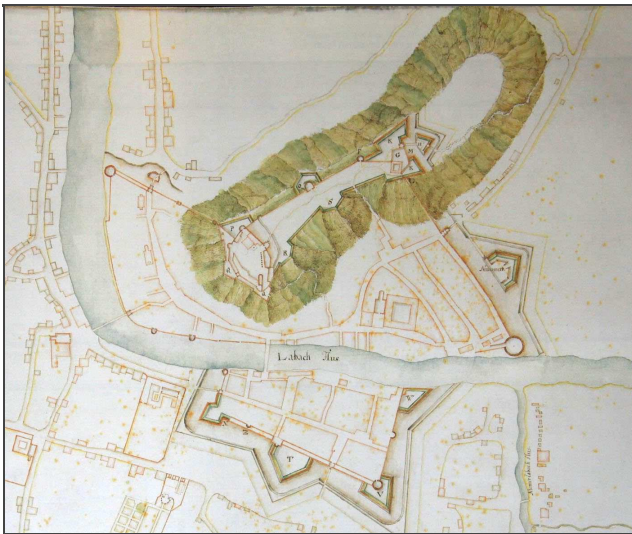
Möglicher Ausbauplan des Ortes und der Burg nach Martin Stier, 17. Jh. (2. Abriß)