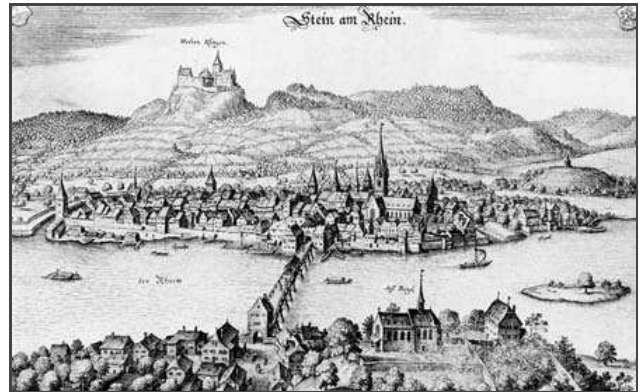
Frauenfelder, Reinhard - Die Kunstdenkmäler des Kantons Schaffhausen, Bd. II: Der Bezirk Stein am Rhein | Basel, 1958 | S. 2

Klicken Sie in das jeweilige Bild, um es in voller Größe ansehen zu können!