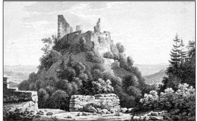
Mittelalter: Zeitschrift des Schweizerischen Burgenvereins, 19. Jhg./Nr. 2 | Basel, 2014 | S. 82

Klicken Sie in das jeweilige Bild, um es in voller Größe ansehen zu können!