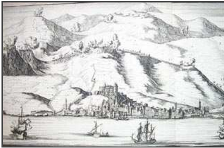
Veduta i plan Šibenika sa prikazom šibenske luke | 1704.

Informationen für Besucher | Bilder | Grundriss | Historie | Literatur | Links