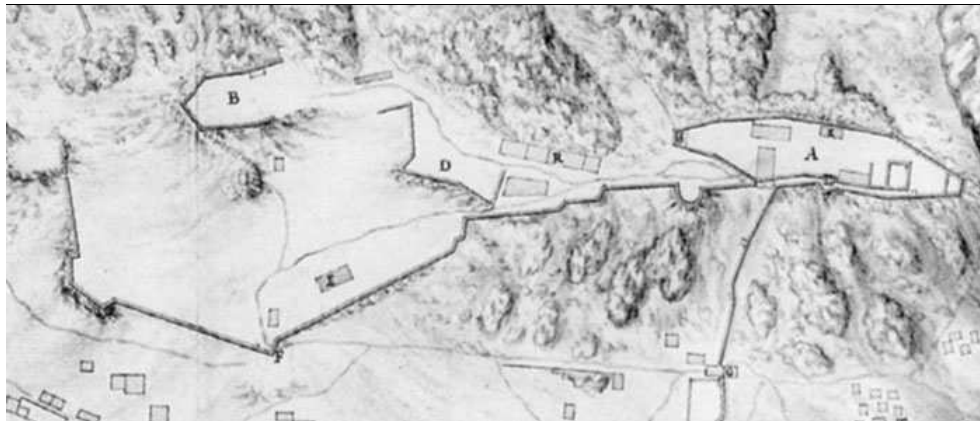
Ausschnitt aus einer zeitgenössischen Zeichnung des venezianischen Militäringenieurs G. Juster, 1708.