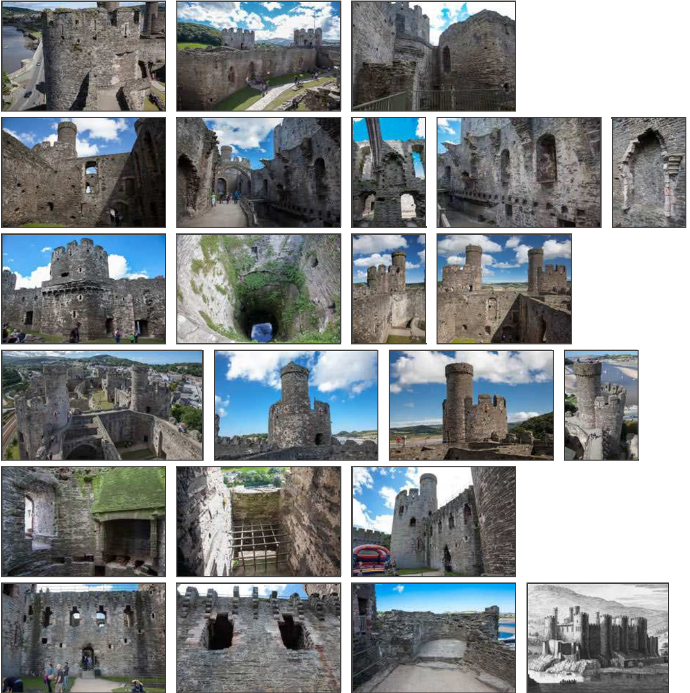
Klicken Sie in das jeweilige Bild, um es in voller Größe ansehen zu können!