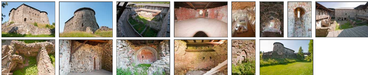
Klicken Sie in das jeweilige Bild, um es in voller Größe ansehen zu können!