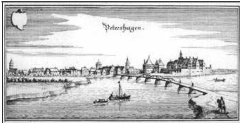
Quelle: Matthäus Merian d. Ä. - Topographia Westphaliae (Westphalen) | 1647.

Informationen für Besucher | Bilder | Grundriss | Historie | Literatur | Links