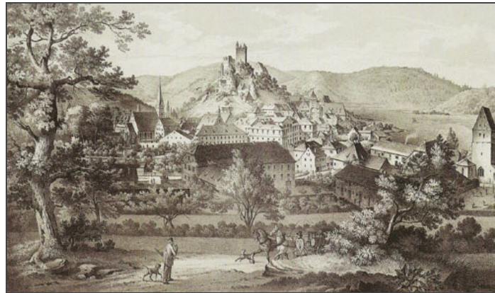
Lithographie von C. Grünwedel, 1835.

Informationen für Besucher | Bilder | Grundriss | Historie | Literatur | Links