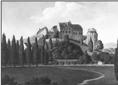
Quelle: Gemälde aus dem 19. Jh.

Informationen für Besucher | Bilder | Grundriss | Historie | Literatur | Links