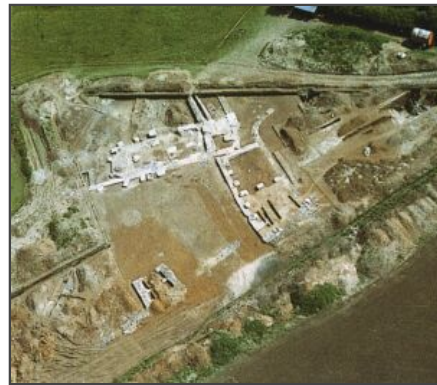
Archäologische Denkmäler in Hessen 84, 1985

Informationen für Besucher | Bilder | Grundriss | Historie | Literatur | Links