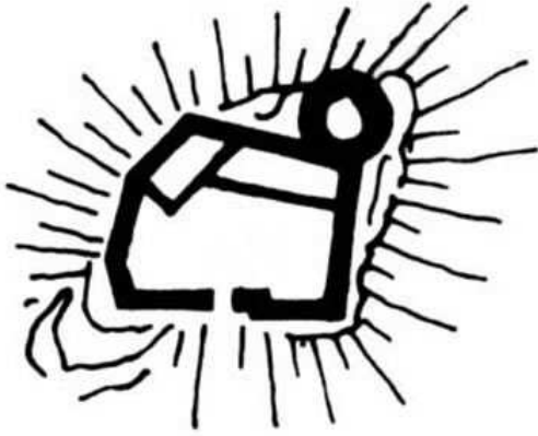
Grundriss der verschwundenen Westburg.